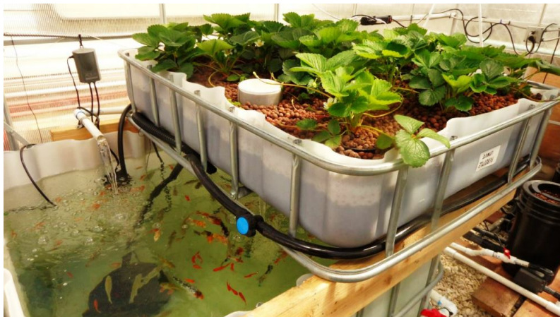
A felvétel csak illusztráció!

A konzorcium árbevétele tavaly 284,59 millió forint volt 155,89 millió forinttal kevesebb, mint 2014-ben.